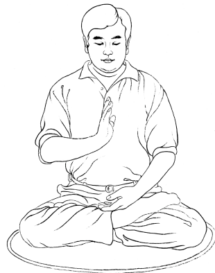
Eén handpalm rechtop houden